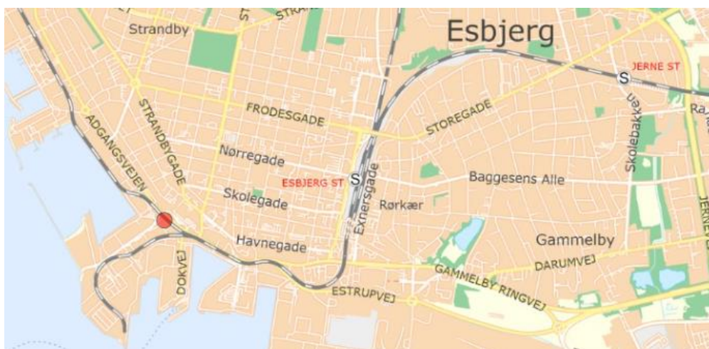
Figur 1: Oversigtskort - ikke målfast - Rød prik angiver placering af boringen

Arealet er ejet af den Kommunale Selvstyrehavn Esbjerg, Hulvejen 1, 6700 Esbjerg. Boliger er ejet af KOLD EJENDOMME ApS, D Lauritzens Vej 4, 6700 Esbjerg.